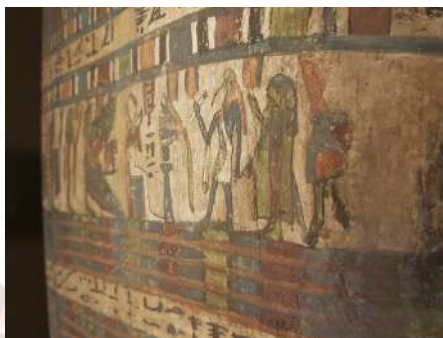
Détail sarcophage féminin au nom de Shap-en-nyty Sycamore stucqué et peint Provenance : Thèbes, Esna ou Assouan (Haute-Égypte sud) Production inconnue 550 av. J.-C. (XXVI e Dynastie, début de l'époque perse) Collection Brunswick Achat de l'Institut Calvet, 1867 Inv. A 304